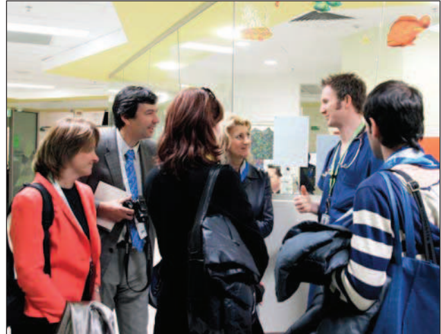
Во время осмотра приемного отделения неотложной скорой помощи в детском госпитале Мельбурна