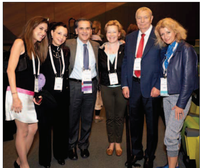
Встреча с коллегами