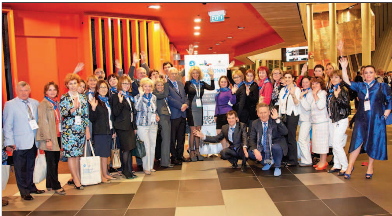
Делегация педиатров России с коллегами из Украины