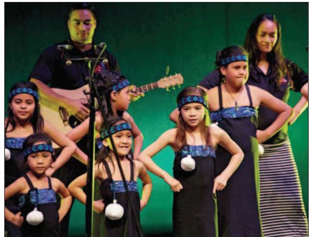
Делегатов приветствовали маленькие артисты

детей в действии», призвал еще теснее сплотить ряды педиатров мира для совершенствования качества оказания помощи детям во всех странах и на всех континентах.